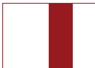
2. Pół strony