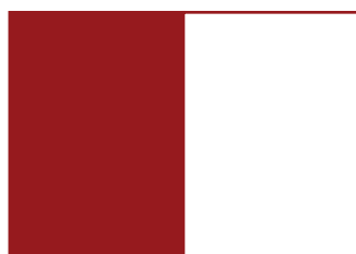
1. Cała strona

UWAGA: * do powyższych wymiarów należy doliczyć spód 5 mm