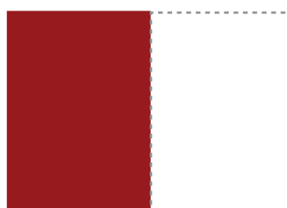
5. I okładka