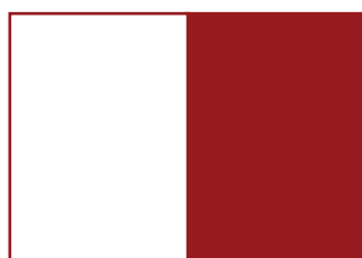
7. III okładka